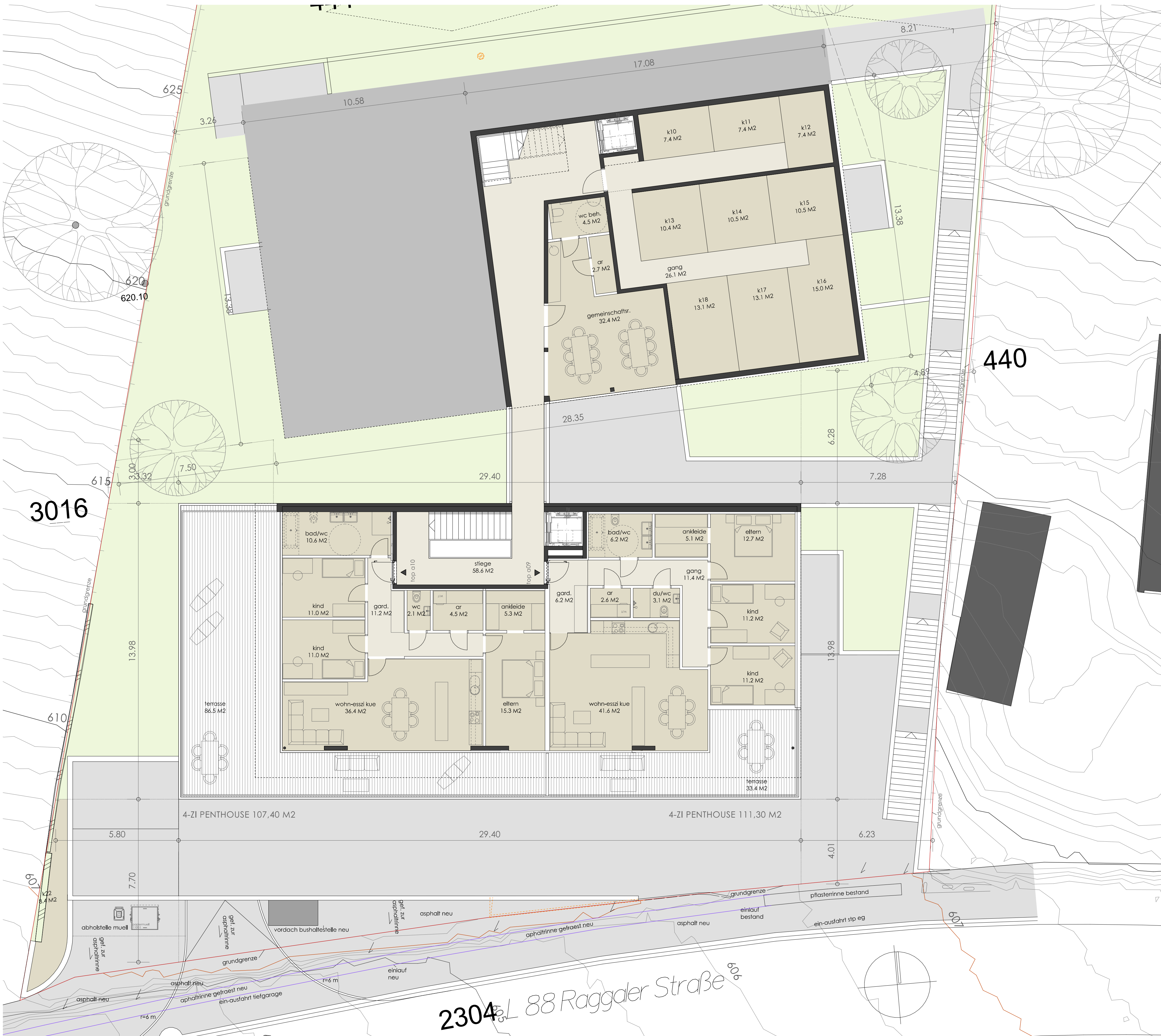
HAUS A DG HAUS B UG 1:100