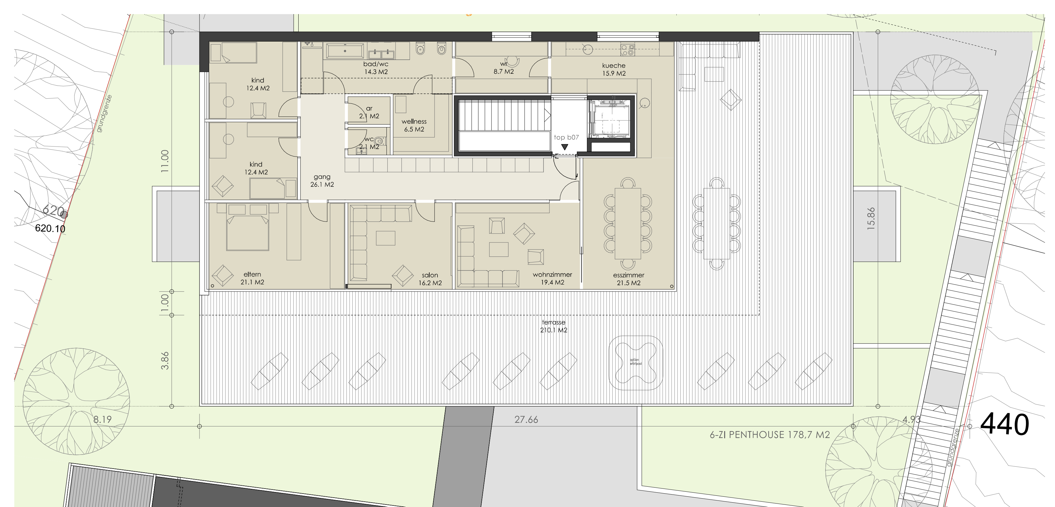
HAUS B DG 1:100