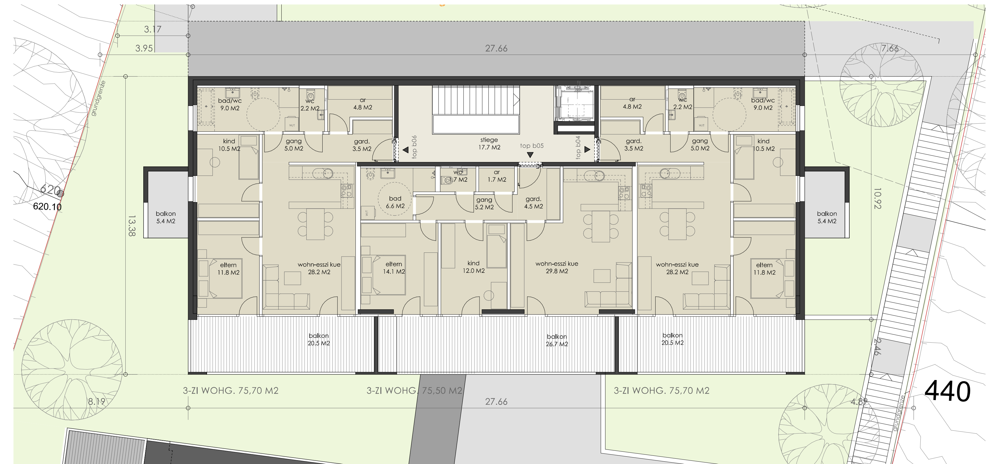
HAUS B OG1 1:100